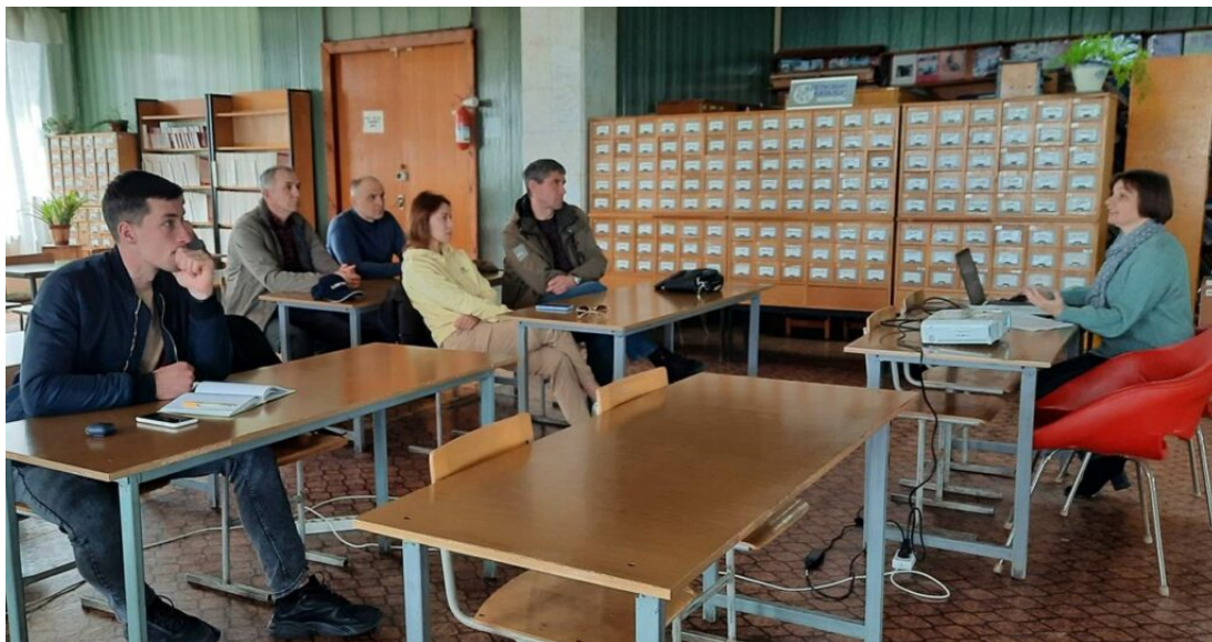
Наукова бібліотека Хмельницького національного університету, кафедра теорії і методики фізичного виховання і спорту

Загальні питання: centr@khnmu.edu.ua Публікація матеріалів: press@khnmu.edu.ua